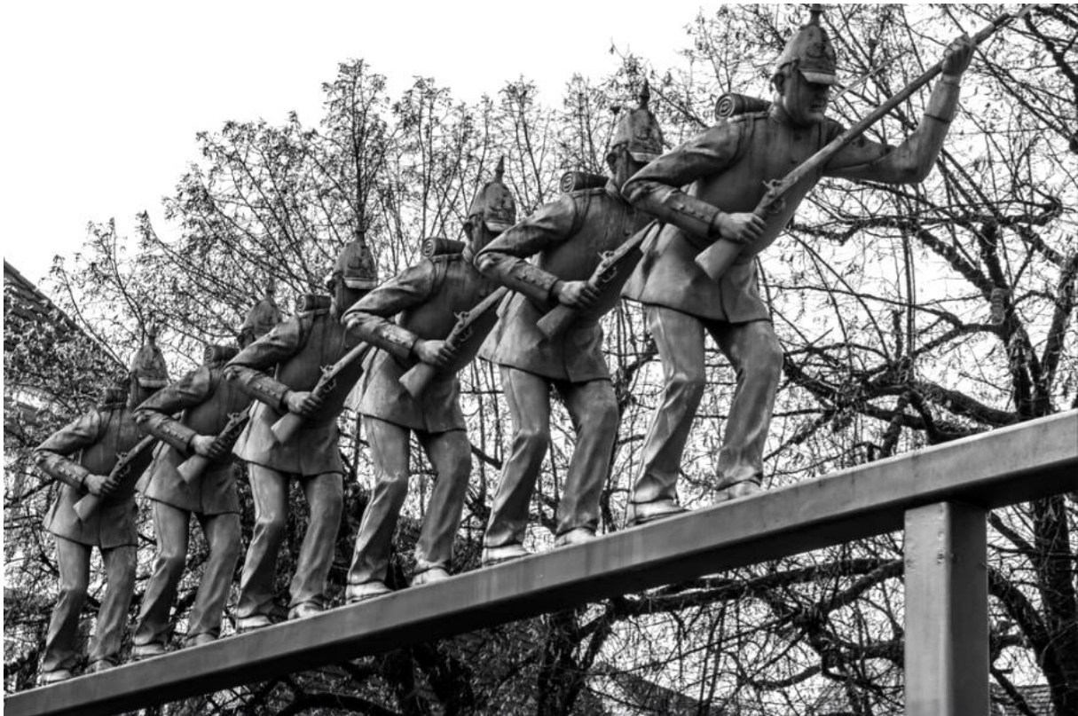
Detail des Denkmals zur Badischen Revolution 1848 von Peter Lenk in Schopfheim (Die Preussen)

Gemeinde Basel-Bethesda Gemeinde Birsfelden-Neubad